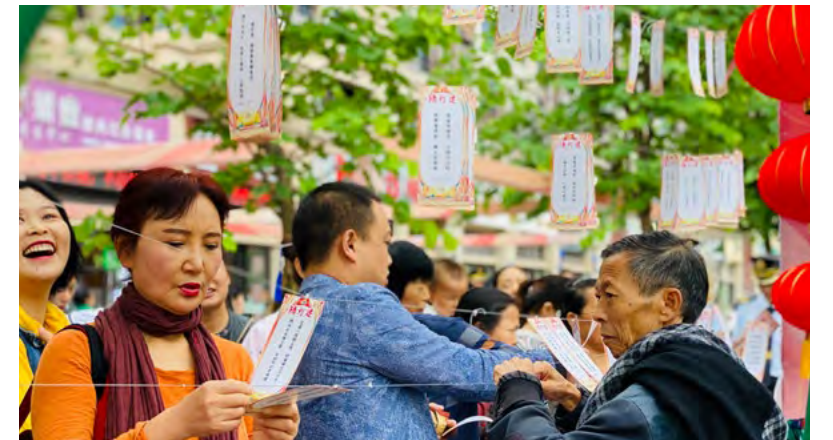
携手猜灯谜，赢取惊喜好礼

邦泰用一次次邻里节活动，为冰冷的钢筋水泥注入幸福的内容，消抹掉邻里之间的界限，让邦主们于日渐深厚的邻里情谊中，乐享到更有品位的邦泰生活。