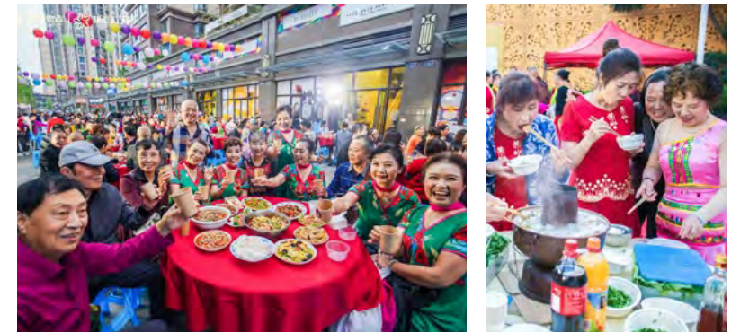
美味邻里宴，温情于欢聚中传递