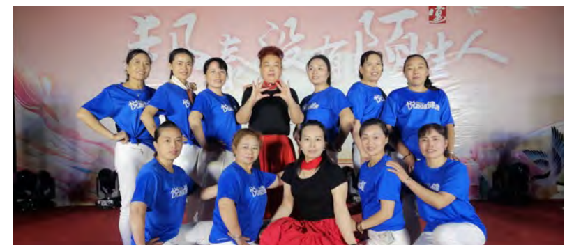
定格文艺汇演的美好瞬间，感受邻里的亲密无间